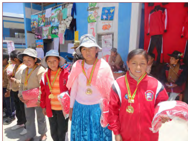
Premiación a las niñas y niños ganadores de las olimpiadas organizadas por el colegio de Chajlaya en el municipio de Chuma, el 19 de noviembre.

terre des hommes suisse Pour l'enfance et un développement solidaire