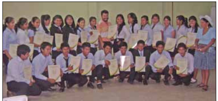
Las autoridades municipales de Puerto Villarroel asistieron al acto de graduación de las y los jóvenes de la región.

A los actos de graduación realizados en cada municipio asistieron las autoridades municipales y los ejecutivos de las federaciones del trópico que valoraron el esfuerzo de las y los adolescentes.