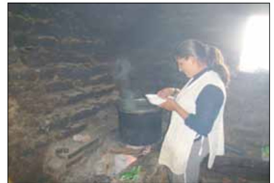
En el internado de Cantar Gallo quieren reducir el uso de leña para cocinar y canalizar mejor la salida del humo.