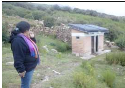
Las duchas con sistema termosolar se encuentran en mal estado.

Alrededor de 400 niños y niñas de comunidades rurales aprenderán a ahorrar energía utilizando tecnologías apropiadas y socializarán sus conocimientos con sus comunidades.