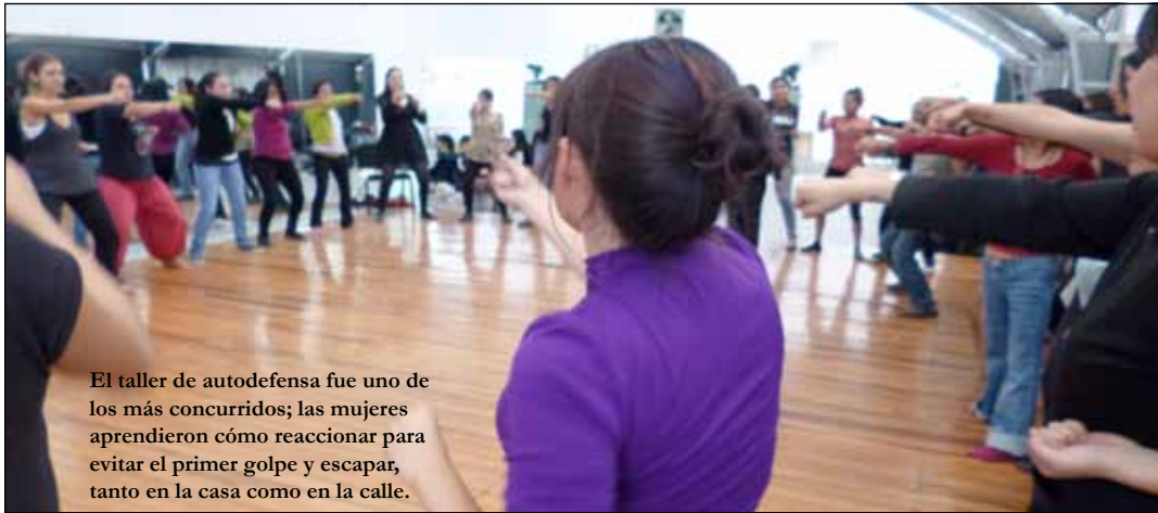
El taller de autodefensa fue uno de los más concurridos; las mujeres aprendieron cómo reaccionar para evitar el primer golpe y escapar, tanto en la casa como en la calle.

laborales de las madres trabajadoras del hogar. La actividad organizada en La Paz por el movimiento feminista Mujeres Creando y el programa radial “Soy trabajadora del hogar con orgullo y dignidad”, del 6 al 8 de diciembre, reunió a casi dos centenares de mujeres, varias de las cuales provenían de Santa Cruz, Sucre, Cochabamba y Oruro.